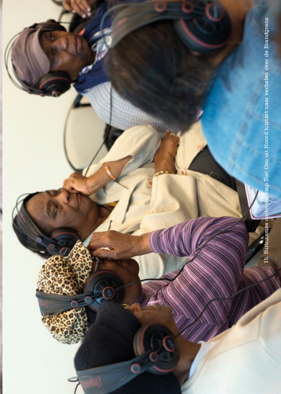
15. Surinaamse ouderengroep Toni Oso uit Noord luistert naar verhalen over de Brandgraven