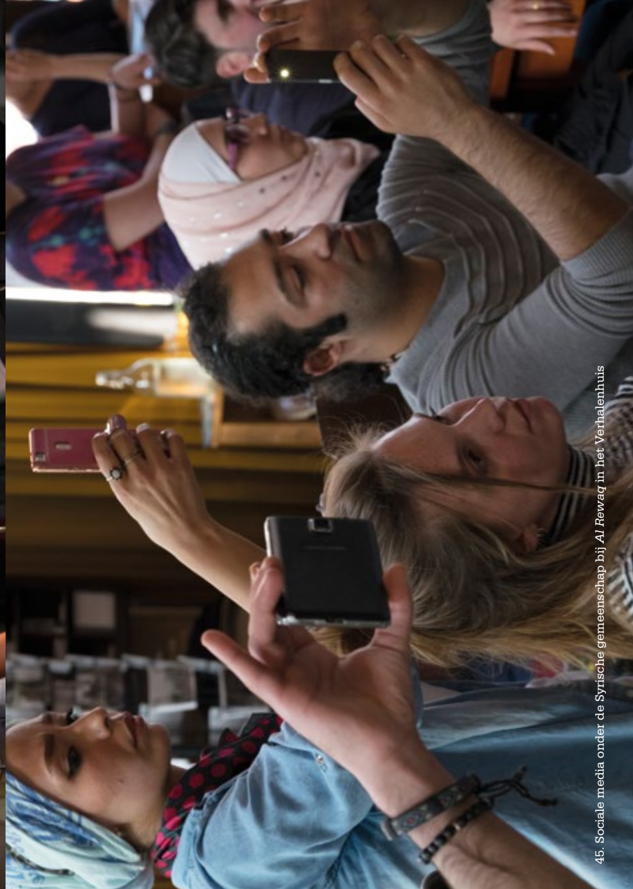
45. Sociale media onder de Syrische gemeenschap bij Al Rewaq in het Verhalenhuis