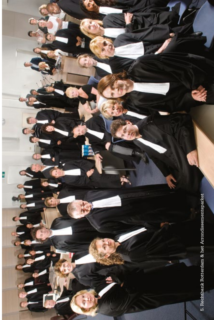
5. Rechtbank Rotterdam & het Arrondissementsparket