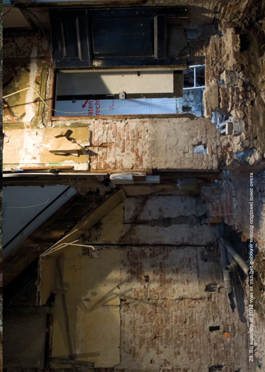
29. Bij aankoop in 2012 was er van het gebouw weinig origineel meer overa