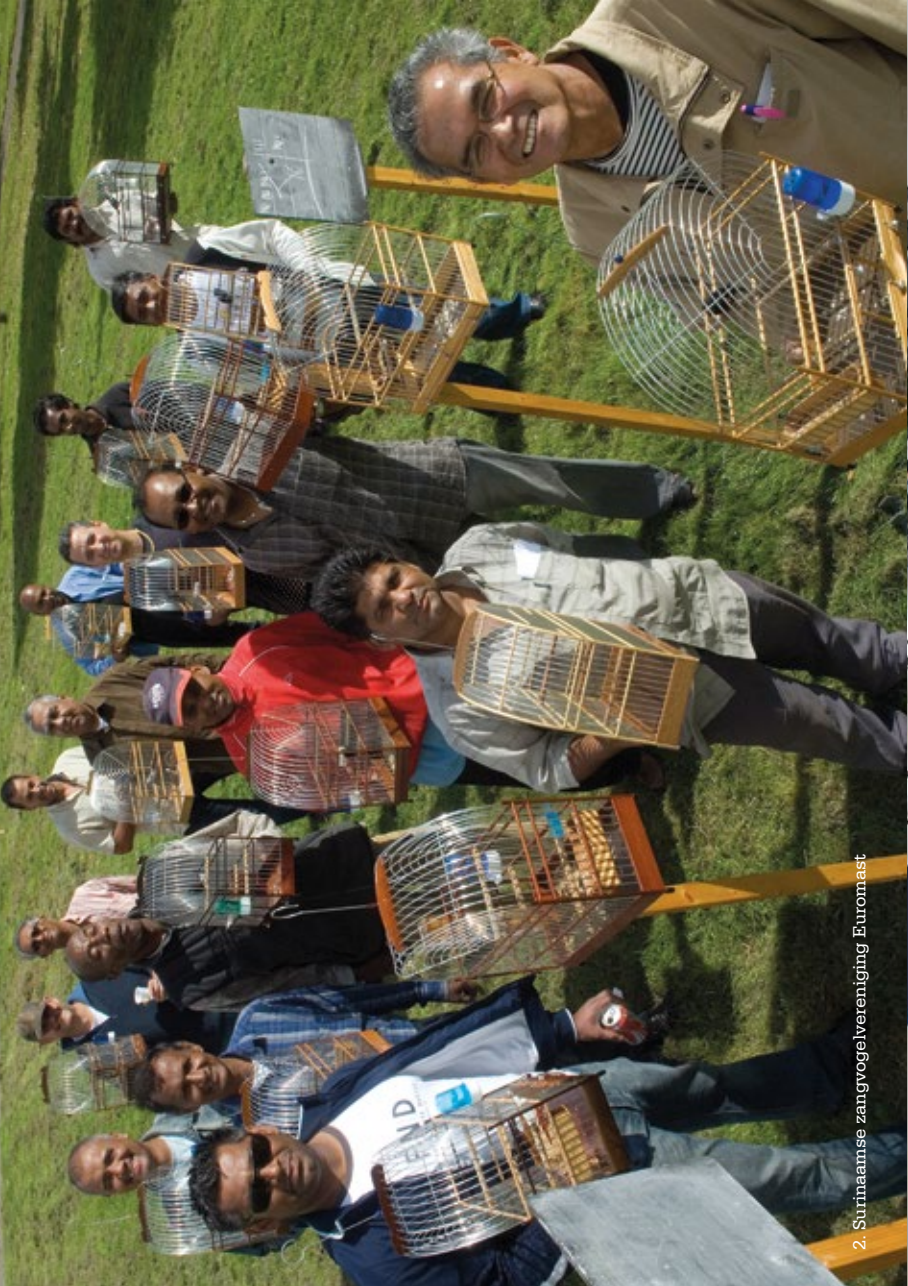
2. Surinaamse zangvereniging Euromast