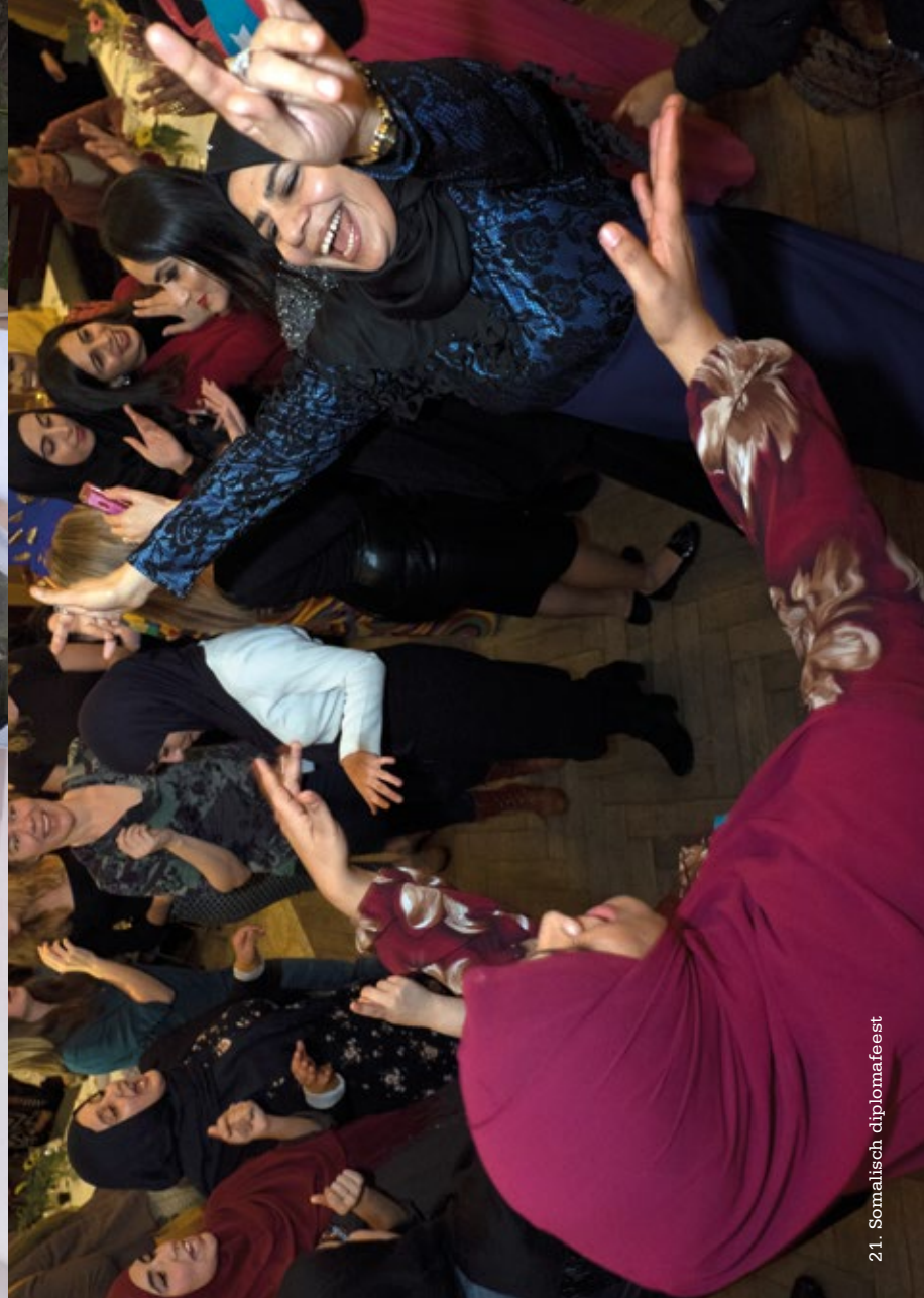
21. Somalisch diplomafeest