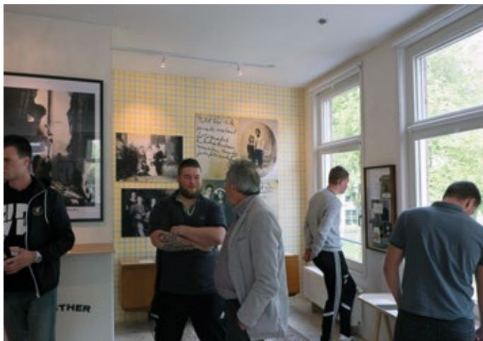
Joods project met Feyenoord en Anne Frank Stichting (2016)

Ook is het Verhalenhuis partner in een bijzondere pilot geworden. Samen met Feyenoord, RADAR (Rotterdams bureau voor gelijke behandeling) en de Anne Frank Stichting ontwikkelden we een traject rondom Feyenoorders met een stadionverbod. Fans die vanwege het roepen van anti-Joodse leuzen niet meer het stadion mogen betreden, krijgen een dag lang ontmoetingen met Joodse Rotterdammers. Ze beginnen in het Verhalenhuis waar eerst wordt verkend wie zij zelf zijn, wie hun vader en hun moeder zijn en wat ze willen vertellen over hun liefde voor Feyenoord en de reden van het stadionverbod. Doordat eerst naar hun verhaal geluisterd wordt beginnen ze toch anders aan zo'n ontmoetingenreeks. Met dit traject hopen we klein maar met impact bij te dragen – van binnenuit.”