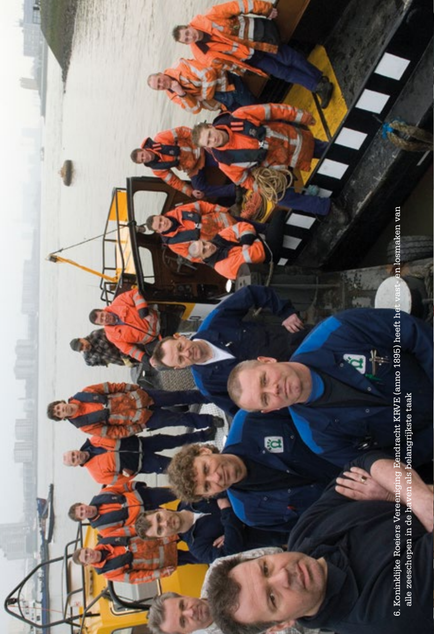
6. Koninklijke Roeiers Vereniging Eendracht KRVE (anno 1895) heeft het vast- en losmaken van alle zeeschepen in de haven als belangrijkste taak