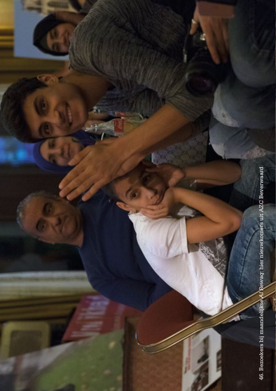
46. Bezoekers bij maandelijksse Al Rewraq; hier nieuwkomers uit AZC Beverwaard