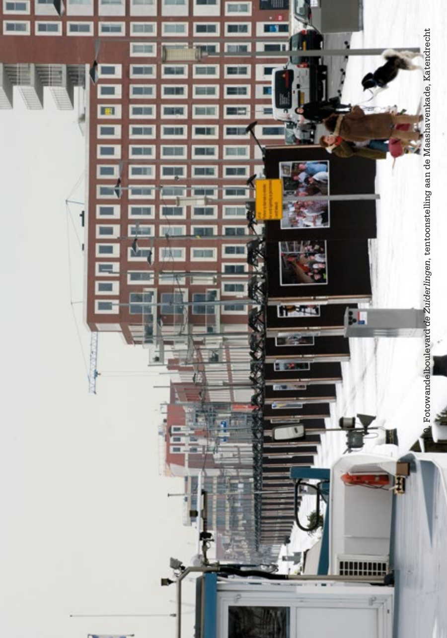
10. Fotowandeboulevard de Zuideringen, tentoonstelling aan de Maashavenkade, Katendrecht