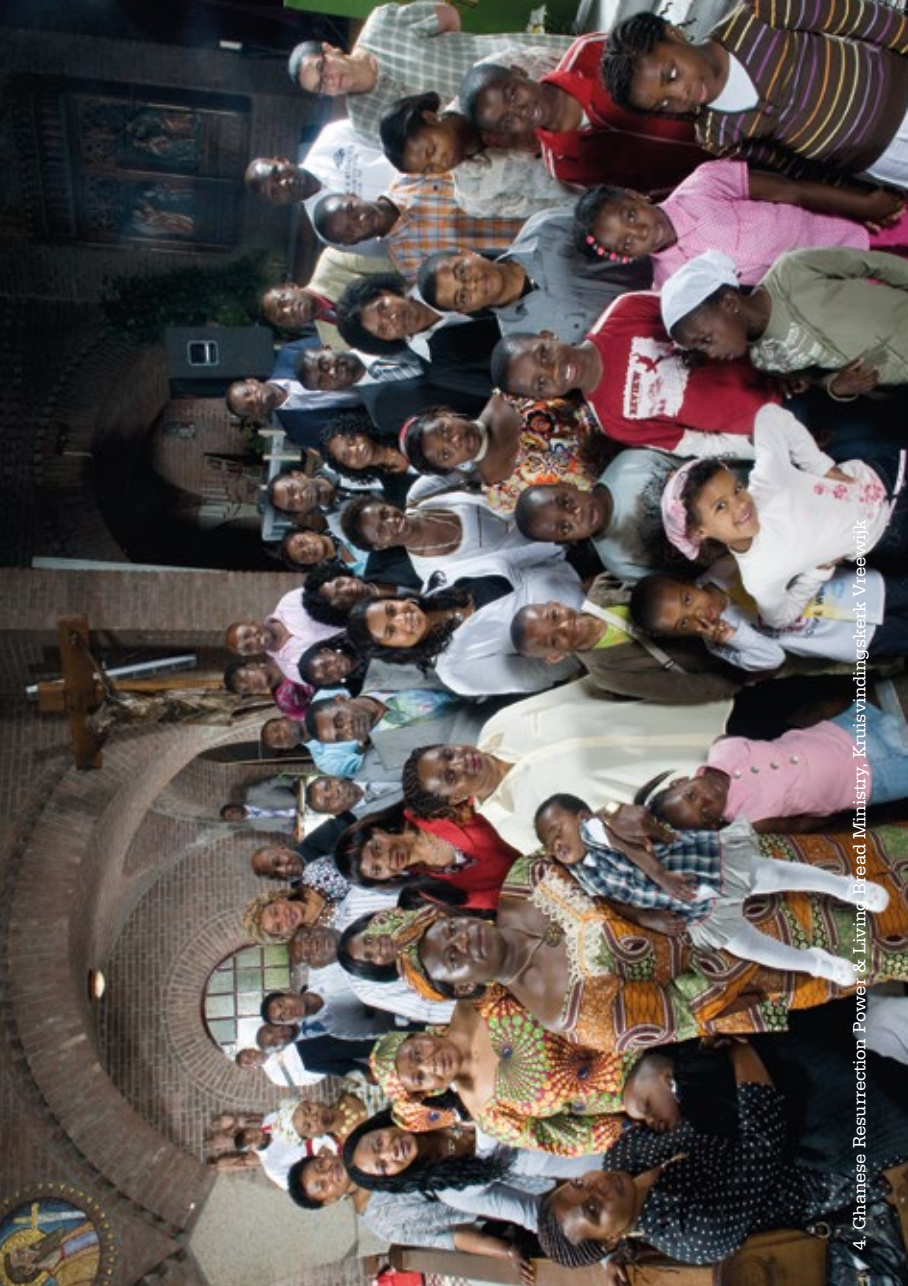
4. Chinese Resurrection Power & Living Bread Ministry, Kruiswindingsekerk Vreeswijk