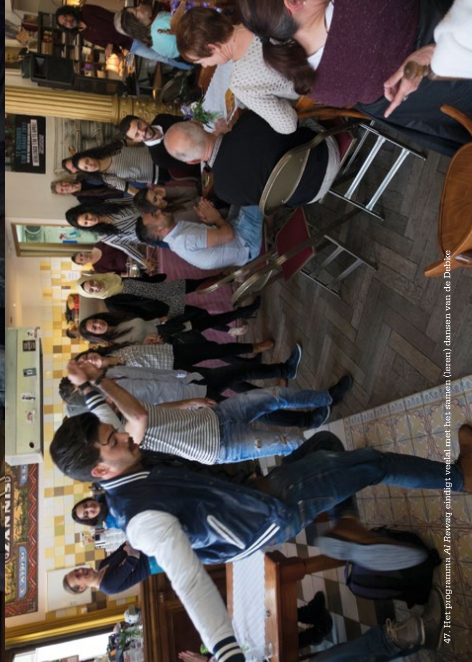
47. Het programma Al Rewraq eindigt veelal met het samen (leren) dansen van de Debbke