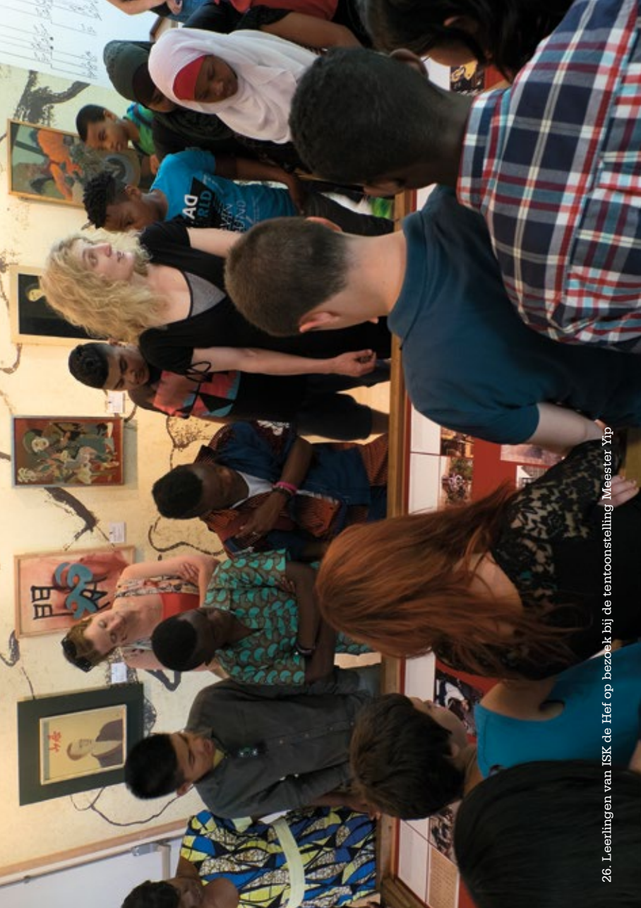
26. Leerlingen van ISK de Hef op bezoek bij de tentoonstelling 'Meester Yip'