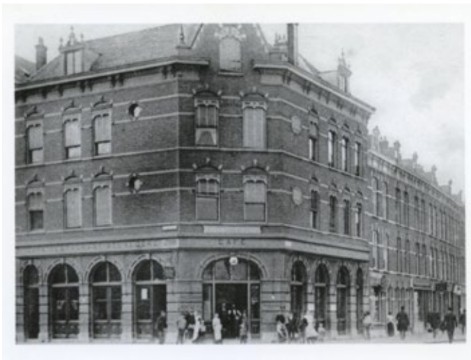
Prentbriefkaart met Café-restaurant Belvédère, c. 1900 – Stadsarchief Rotterdam 4029_PBK-3307