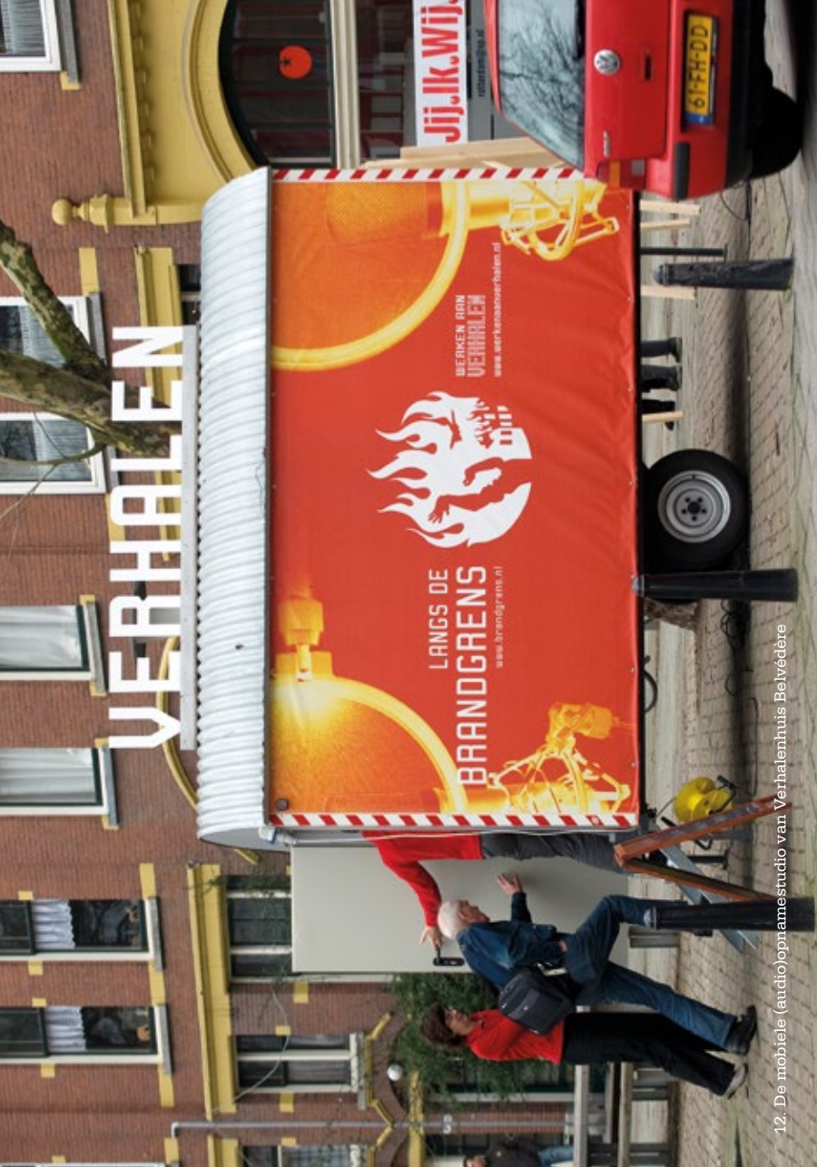
12. De mobiele (audio)opnamestudio van Verhalenhuis Belvédère