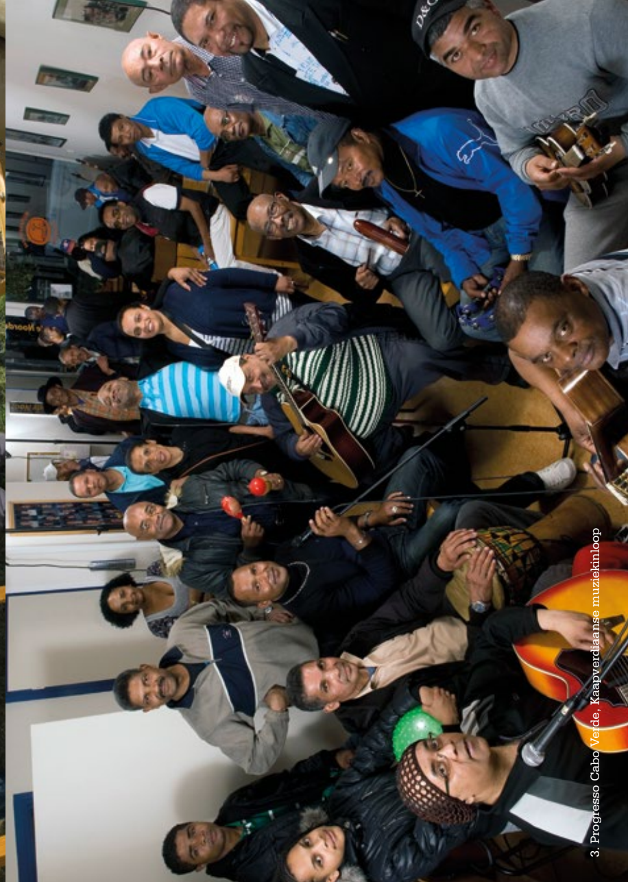
3. Progreso Cabo Verde, Kaapverdianse muziekinloop