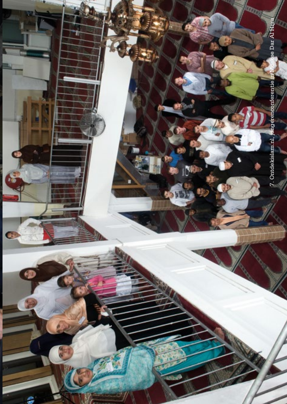
7. Ontdekslam.nl, jongerenconferentie in Moskee Dar Al Hijra