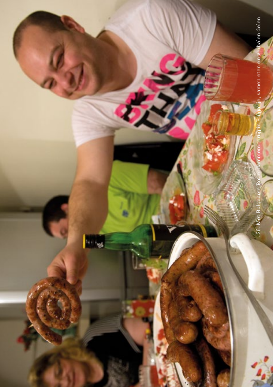
36. Met Bulgaarse Rotterdamers terug in Bulgarije, samen eten en verhalen delen