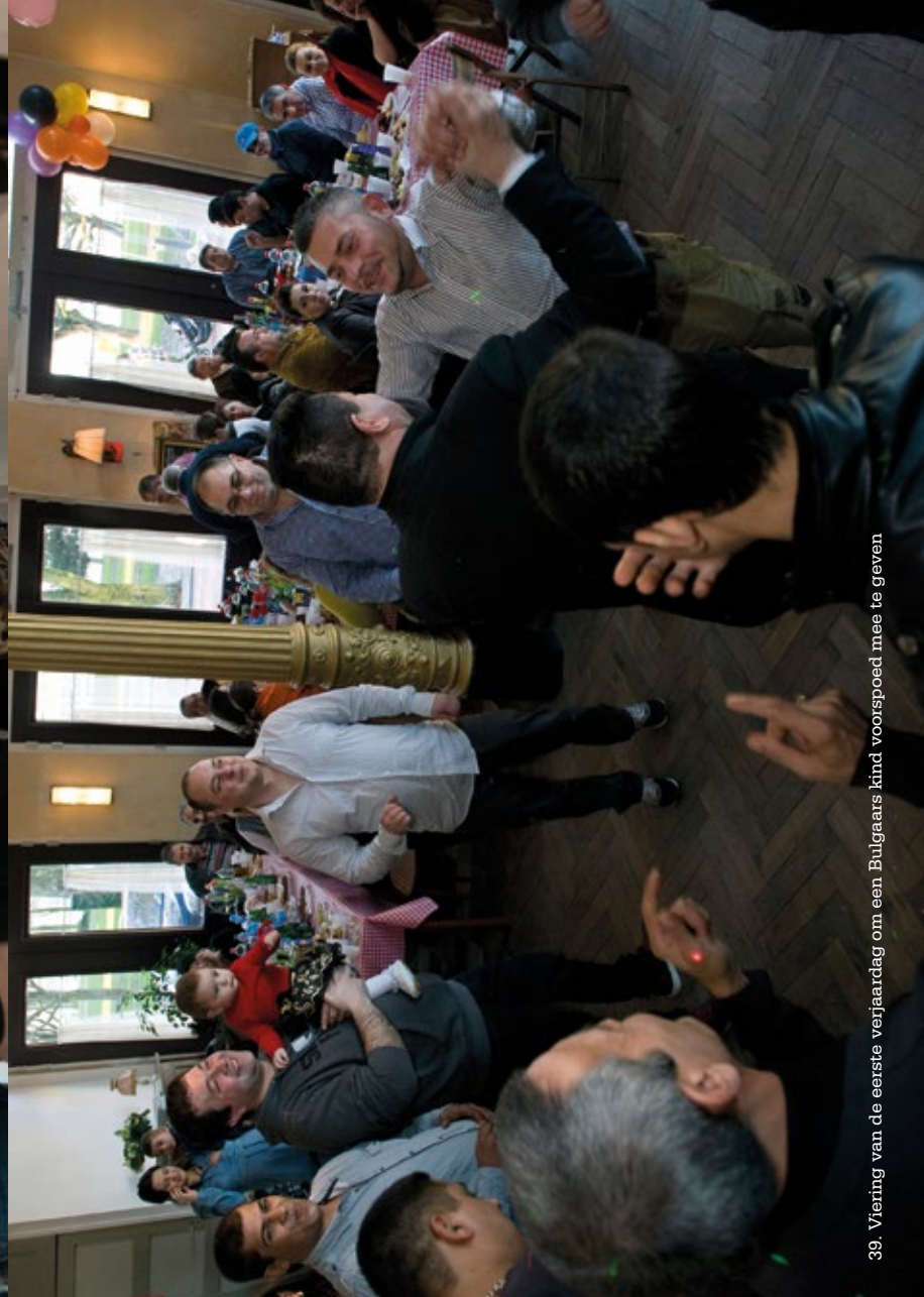
39. Viering van de eerste verjaardag om een Bulgaars kind voorspoed mee te geven