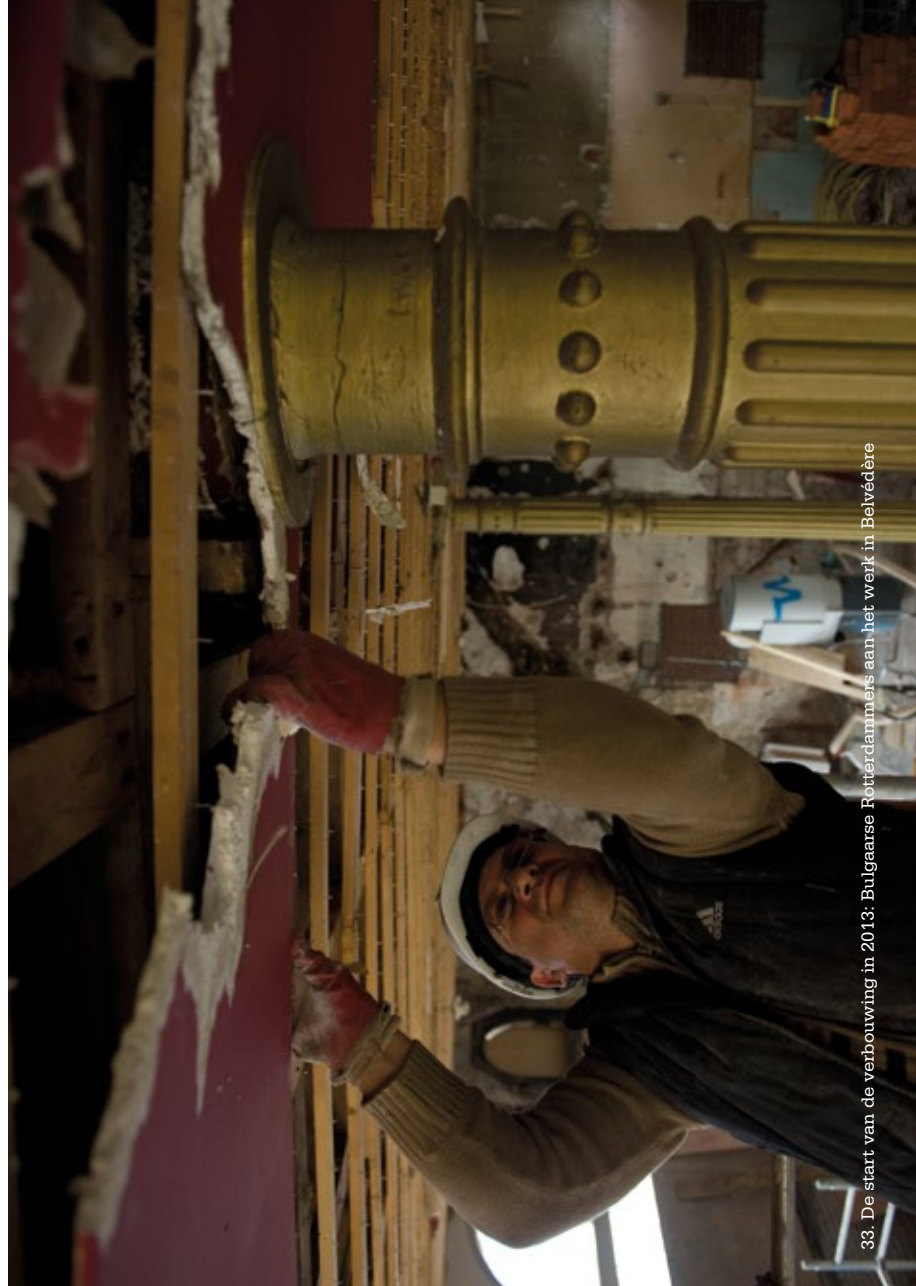
33. De start van de verbouwing in 2013: Bulgaarse Rotterdammers aan het werk in Belvédère