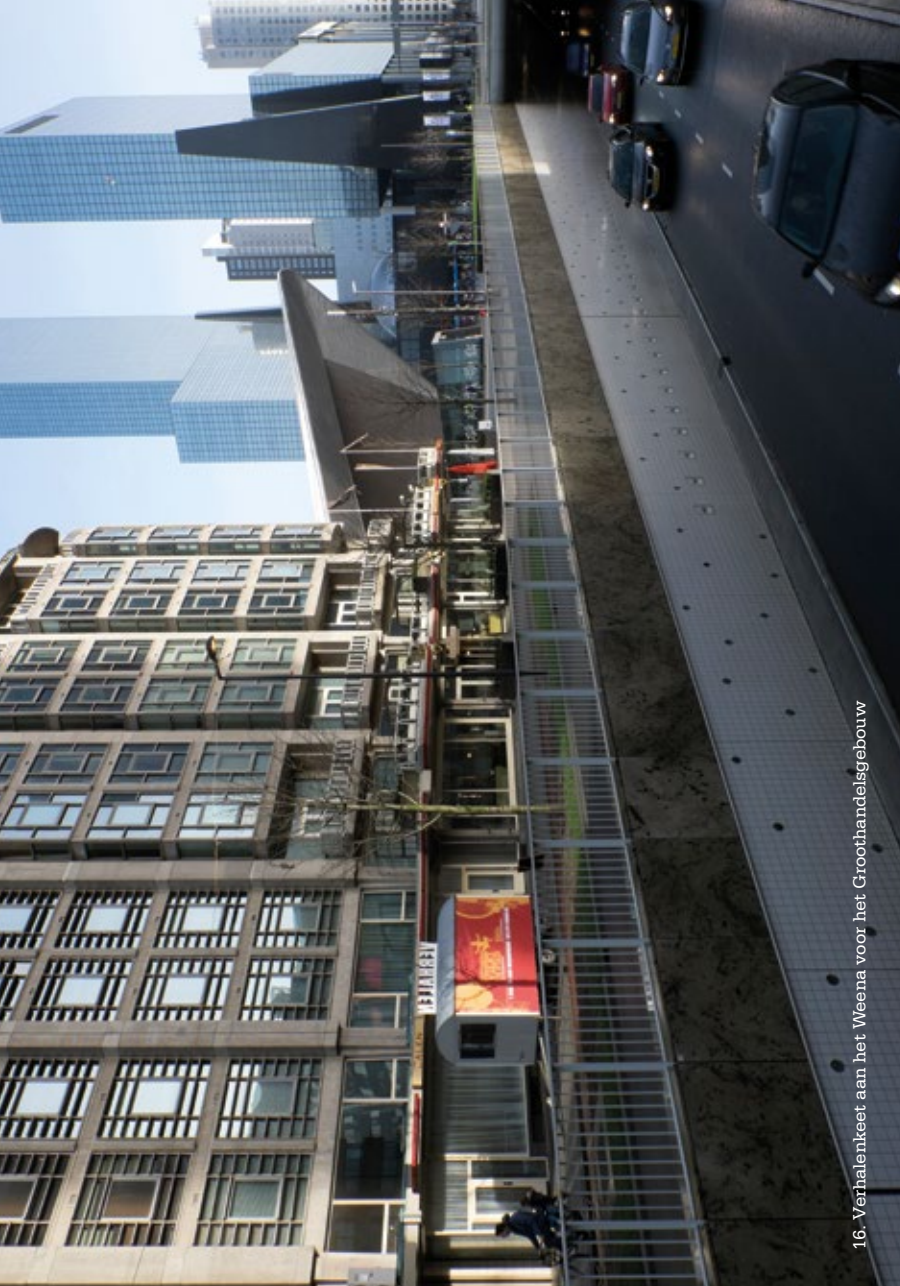
16. Verhalenkeet aan het Weena voor het Groothandelsgebouw