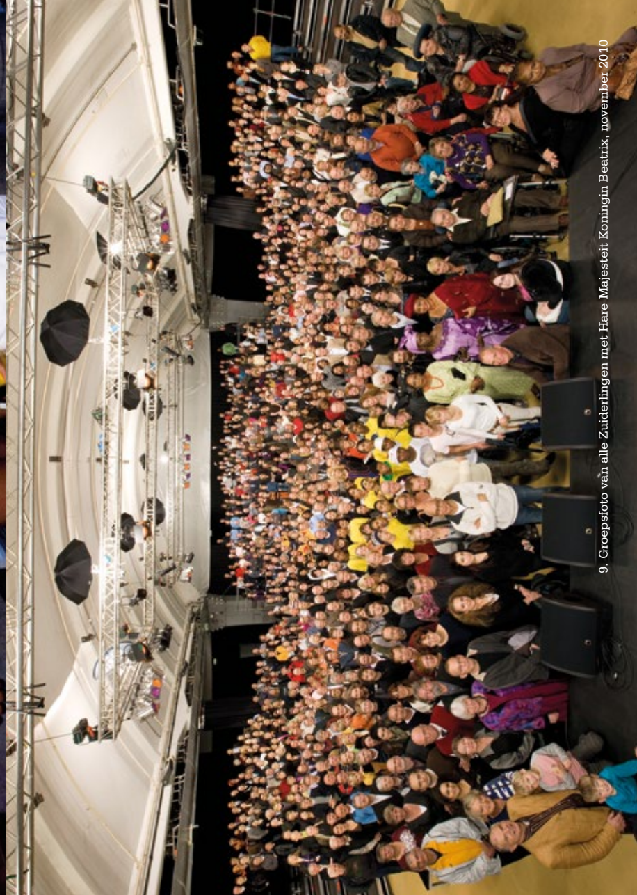
9. Groepsfoto van alle Zuiderlingen met Hare Majesteit Koningin Beatrix, november 2010