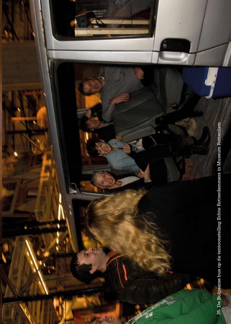
35. De Bulgaarse bus op de tentoonstelling Echte Rotterdammers in Museum Rotterdam