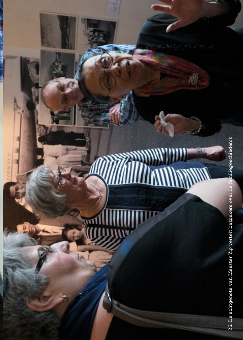
25. De echtgenote van Meester Yip vertelt bezoekers over de familiegeschiedenis