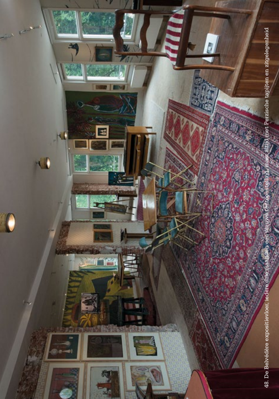
48. De Belvédère expositievloer, iedere drie maanden een nieuwe tentoonstelling, maar altijd met Perzische tapijten en zitgelegenheid