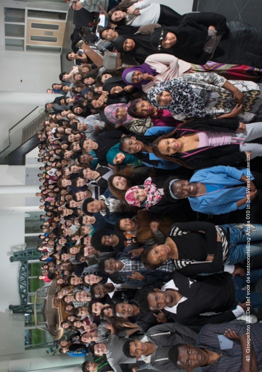
40. Groepsfoto IJK De Hei voor de tentoonstelling Afrika 010 in het Wereldmuseum